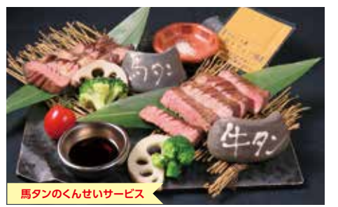
馬タンのくんせいサービス

熊本市中央区下通1-11-17 ライオンビル松蔭館らいと館 TEL/096-351-0603 営/11:00~16:00(OS15:30) 17:00~24:00(OS23:00) 席/50(個室有) 駐/無 休/不定休