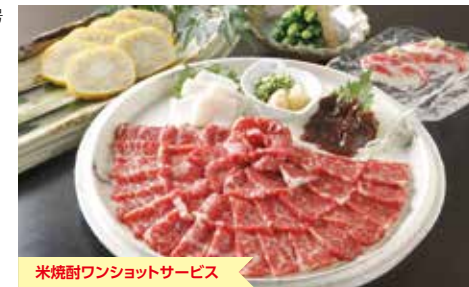
米焼酎ワンショットサービス

おすすめメニュー 特選霜降り馬刺し 2,592円 鯛あらワイン煮 1,944円 和風ローストビーフ 1,944円