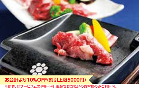
お会計より10%OFF(割引上限5000円) ※他券、他サービスとの併用不可、現金でお支払いのお客様のみご利用可。