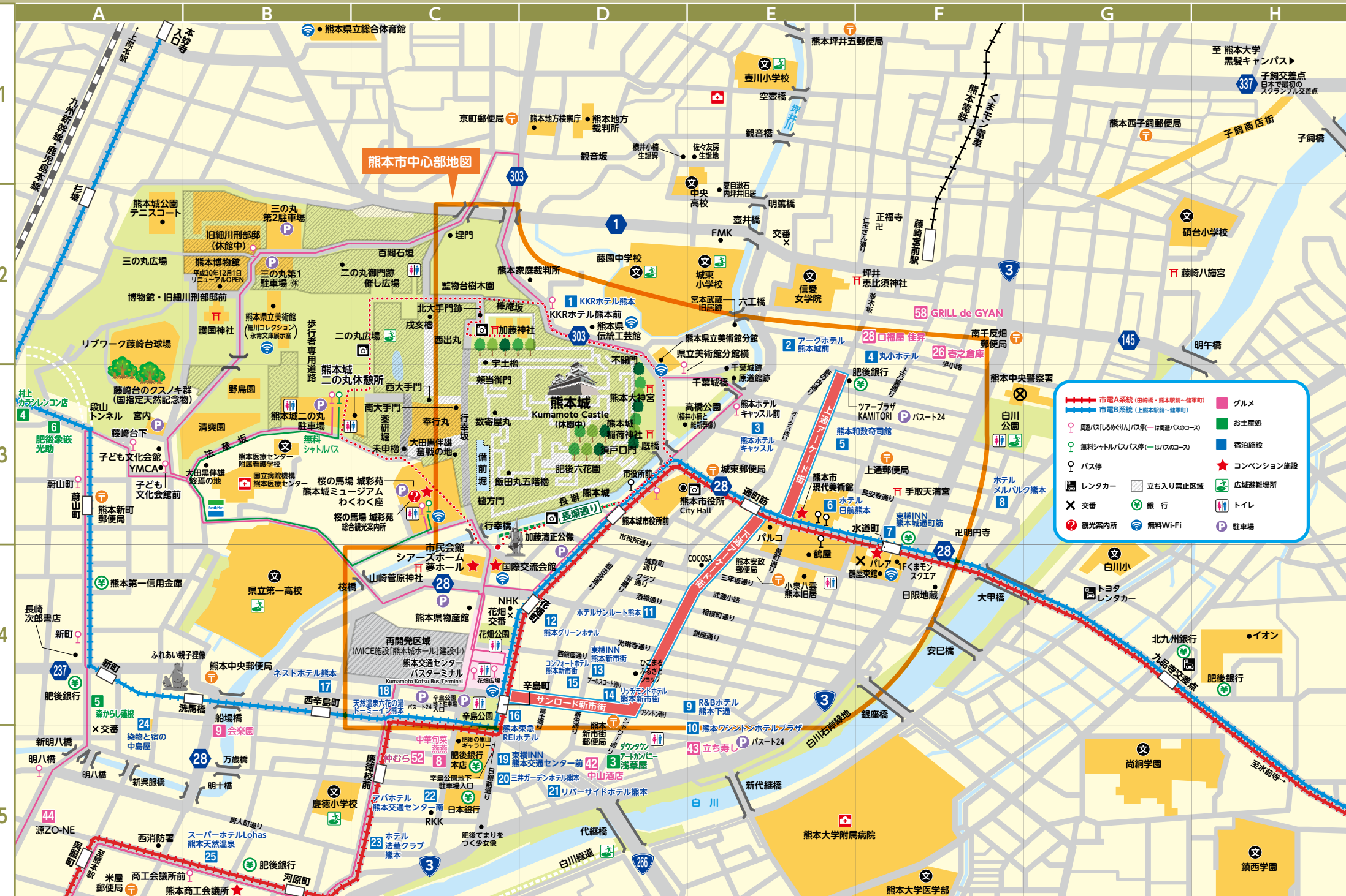
熊本市中心部地図