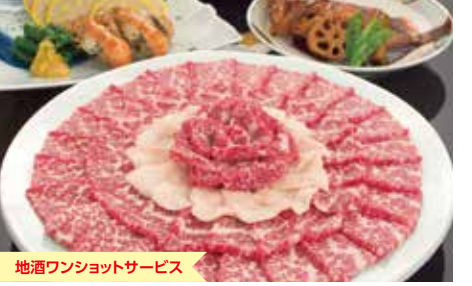
地酒ワンショットサービス