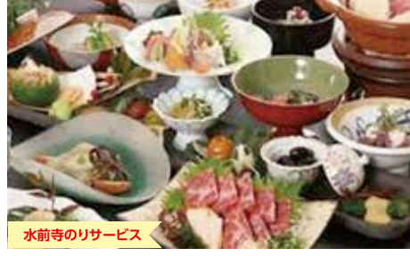
水前寺のリサービス

カウンターに大皿で並んだ料理は、心む熊本の「おふるの味」。手間ひまかけた会席料理や各種馬肉料理も人気です。