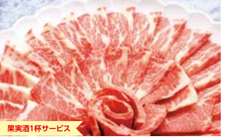
果実酒1杯サービス