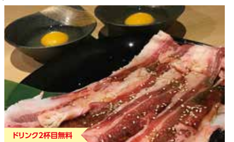
ドリンク2杯目無料

熊本市中央区新市街6-4 セカンドアレイビル4F TEL/096-288-0026 営/18:00~翌3:00 席/27(個室有) 駐/無 休/無