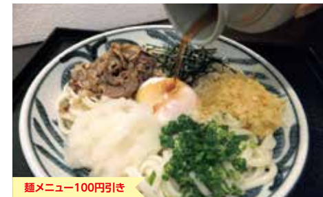
麺メニュー100円引き

おすすめメニュー 温玉ぶっかけうどんスペシャル(冷・温) 842円 とまとにゅうめん 648円 温玉ナポリタン 648円