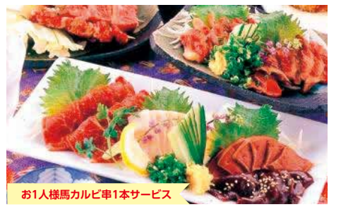
お1人様馬カルビ串1本サービス

熊本市中央区下通1-8-18 アイ銀座ツインビル1F TEL/096-326-8008 営/18:00~23:00 席/29 駐/無 休/日曜日・祝日