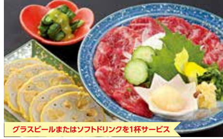
グラスビールまたはソフトドリンクを1杯サービス

ホテル最上階にある店内からは熊本城が一望できます。落ち着いた雰囲気の中で、ぜひ自慢のお料理とお酒をお楽しみ下さい。