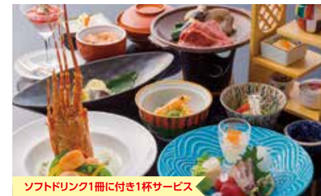
ソフトドリンク1冊に付き1杯サービス

おすすめメニュー 喜び快席 3,780円 和らぎ快席 5,400円 火の国快席(郷土料理) 6,480円