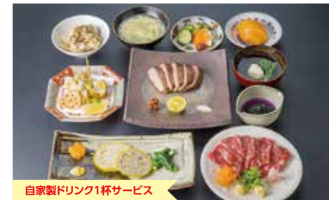
自家製ドリンク1杯サービス

おすすめメニュー 牛肉料理も楽しめる牡丹コース 8,667円 スタンダードな百合コース 5,778円 気軽に楽しむ姫コース 3,500円